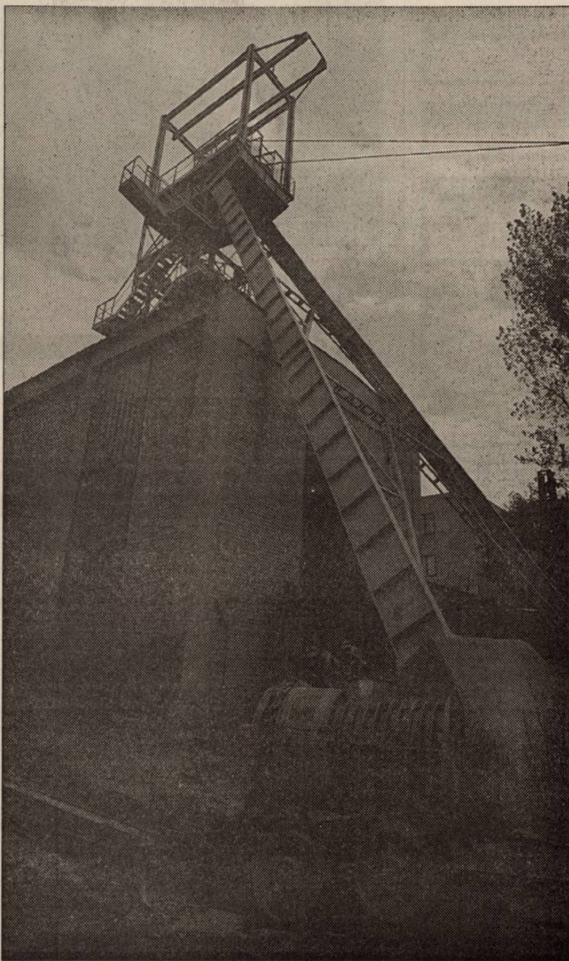
Az Edelényi bánya naponta 1500 tonna szenet is adott...

leépítésével – mondja – vagyis: amilyen ütemben csökken a fejteselőkészítés, a termelés az említett két bányában, annak megfelelően illetve azzal párhuzamosan folya a dubicsányi bánya építése, átmentődne, hasznosulna a felhalmozódott tudás, tapasztalat. Dubicsányban ugyanis edelényi, putnoki és feketevölgyi bányászok dolgoznak, persze csak akkor, ha lesz elegendő vágár, karbantartó szakmunkás, lakatos, villanyszerelő... Mert itt is megtörténhet, ami Márkushegyen, ahol most több száz külföldit alkalmaznak, mert helyben és a környéken nincs elegendő szakképzett munkaerő.